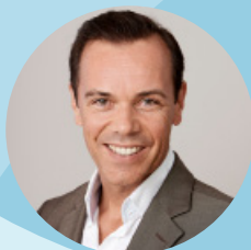
Gerhard Pichler Business Circle