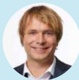
Benno QUADE Software AG