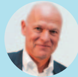
Ulrich Homburg Bahn-Experte / ehem. Vorstand DB