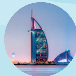
Dubai goes Autonomous