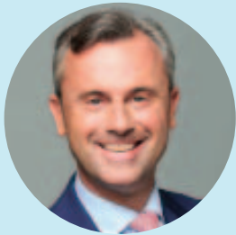
BM Norbert Hofer BMVIT