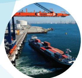
Blockchain LAB Hafen Rotterdam