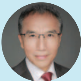
Li Xiaosi Botschafter der Volksrepublik China