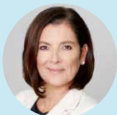
Romy Faisst Business Circle