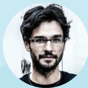
Robert Seeger Agentur für Kommunikationskunst