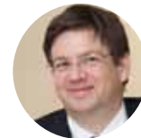
Martin Szelgrad Report Verlag