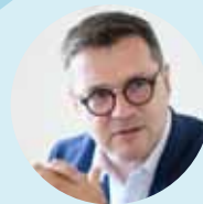
Klaus Steinmaurer RTR GmbH