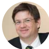
Martin Szelgrad Report Verlag