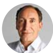
Johannes Rauch, Bundesminister für Soziales, Gesundheit, Pflege und Konsumentenschutz, BMSGPK