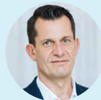
Wolfgang Mückstein BM Soziales, Gesundheit, Pflege, Konsumentenschutz