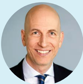
Jubiläums-Keynote Martin Kocher, Bundesminister für Arbeit & Wirtschaft

und 30+ Speaker, die mit der Lehre voran gehen