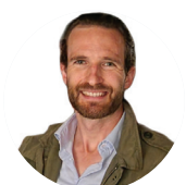
Christian Polder Data Analytics - Austria & Switzerland, Google Cloud