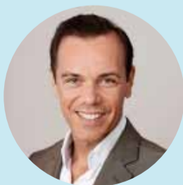
Gerhard Pichler Business Circle