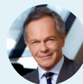
Andreas Treichl Präsident Erste Stiftung