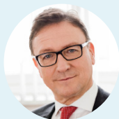
Helmut Ettl Vorstand, FMA

Im Fokus: Zinsniveau - ESG - Transformation - KI Immobilienkrise - Kapitalmarktunion - People & Culture