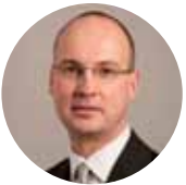
Stefan Walter Generaldirektor DG 1 Europäische Zentralbank