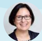
Alexandra Rester Rath AG