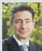
Nikolaus Forgó Universität Wien